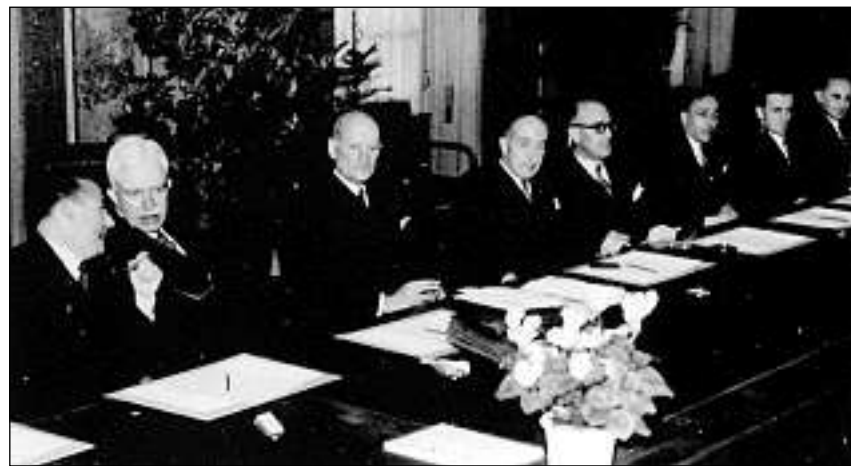
La delegaziun svizra durant las tractativas cun ils alliads, mars 1945.

2. Aur da victimas assassinadas u surviventas da la politica d'extirpaziun dals nazis (aur da victimas).