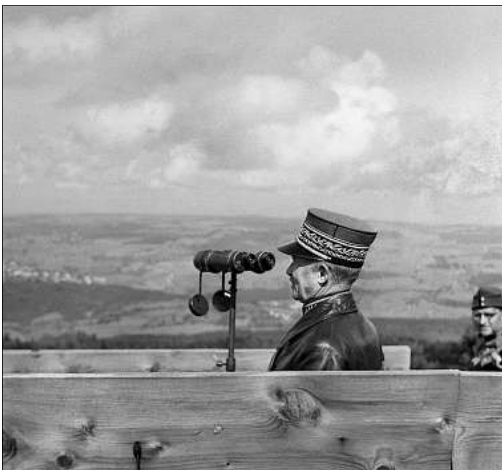
Tge saveva la Svizra davart l'aur dals nazis? General Guisan al cunfin.

Suenter che la Germania aveva provocà la Segunda Guerra mundiala duvrava ella adina dapli materias primas essenzialas per la guerra. Ina da quellas era il wolfram che vegniva explotà surtut en il Portugal. La Germania duvrava perquai escudos ch'ella sa procurava en barat cun aur tar bancas commercialas svizras. Quest aur vegniva alura vendì sin il mar-